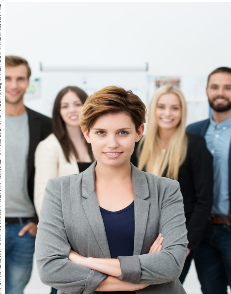
851-479 | Stand: 04/2016 | Druck: LVR-Druckerei, Tel. 0221 809 - 2418

Ausbildung zur Kauffrau und zum Kaufmann im Gesundheitswesen