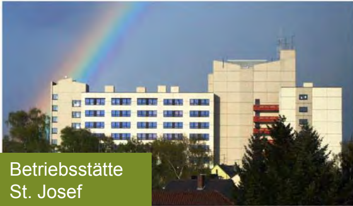
Betriebsstätte St. Josef