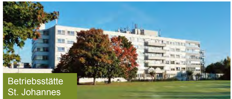
Betriebsstätte St. Johannes