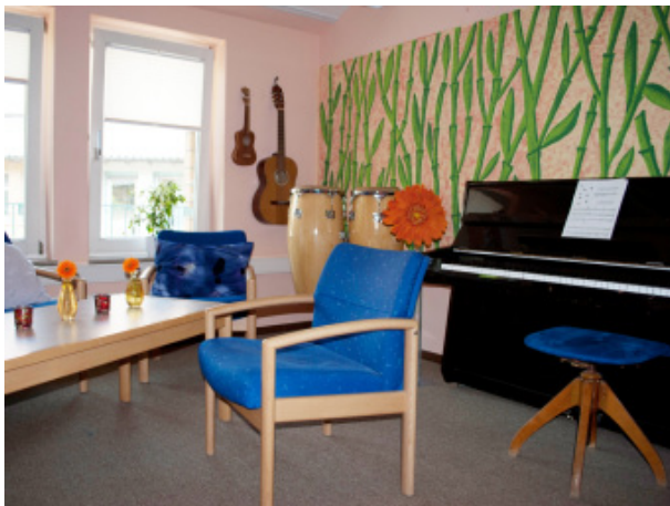
Musik- und Medienraum