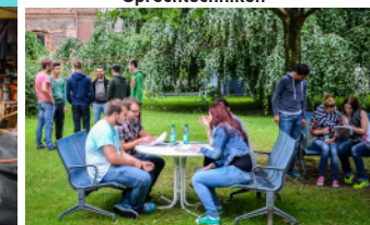
Umsetzung in der Freizeit

851-524 | Stand: 09/2015 | Druck: LVR-Druckerei, Ottoplatz 2, 50679 Köln, Tel. 0221 809-2418