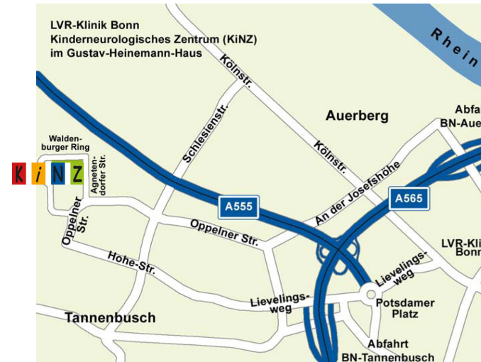
Kinderneurologisches Zentrum KiNZ, Gustav-Heinemann-Haus, Waldenburger Ring 46, 53119 Bonn